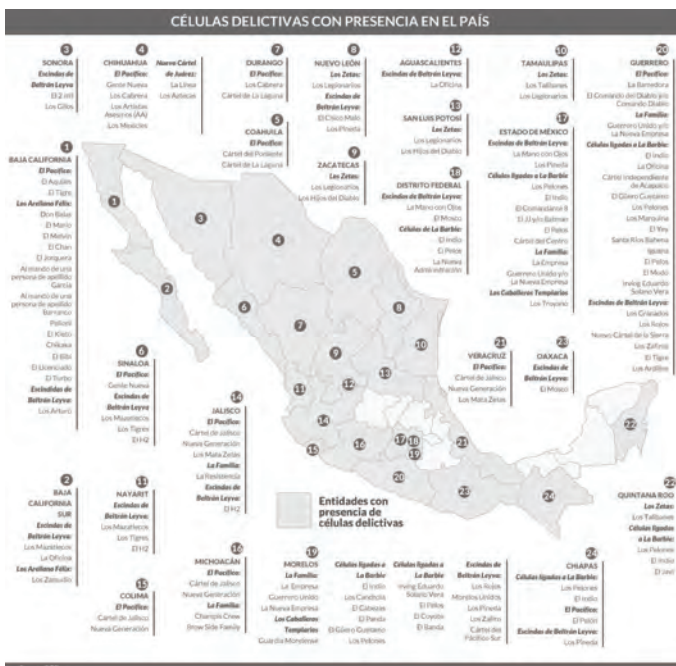
Carta della presenza di narcocartelli

Per capire meglio qual è il sostrato di violenza che attraversa tutto il paese, è necessario osservare la seguente carta di fonte governativa.